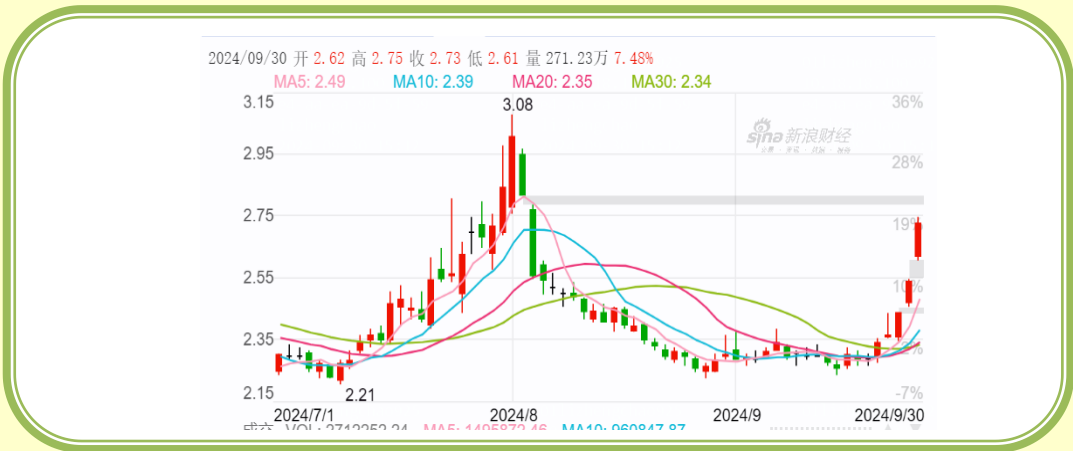
(福田汽车 K 线图，截至 9 月 30 日)