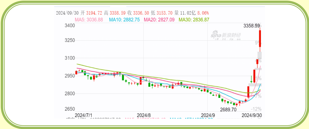
(上证指数 K 线图，截至 9 月 30 日)